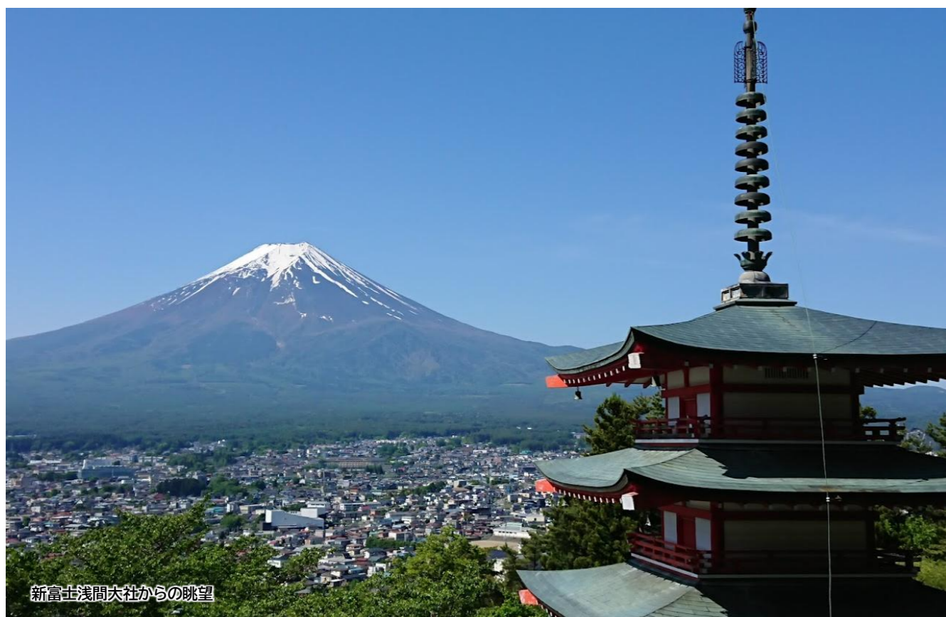
新富士浅間大社からの眺望