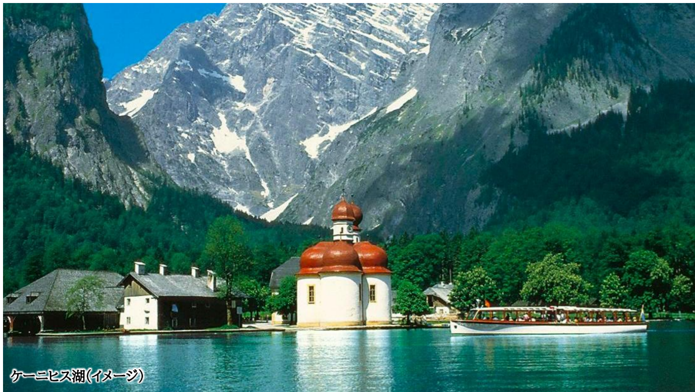
ケーニヒス湖(イメージ)

2026年 9月1日(火)発～9月11日(金)着…¥748,000 お一人部屋利用追加料金 ¥120,000