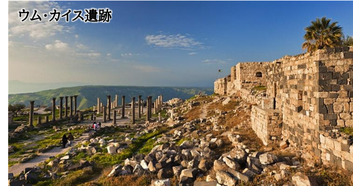
ウム・カイス遺跡