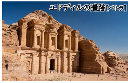
エドディルの遺跡[ペトラ]