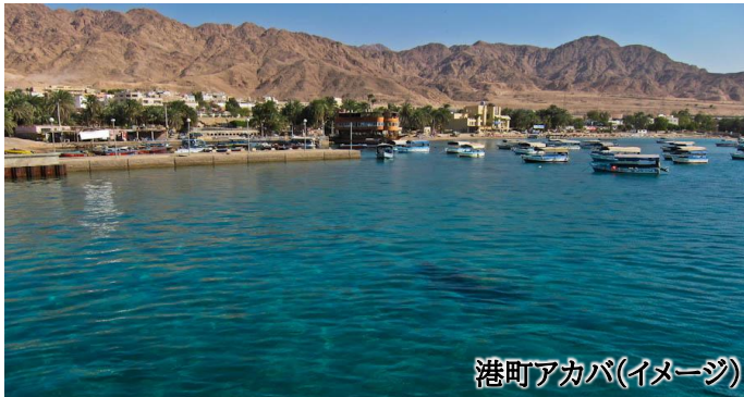
港町アカバ(イメージ)