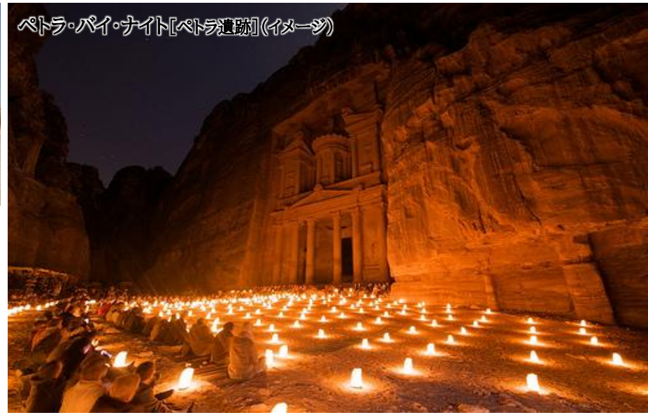
ペトラ・パイ・ナイト[ペトラ遺跡](イメージ)