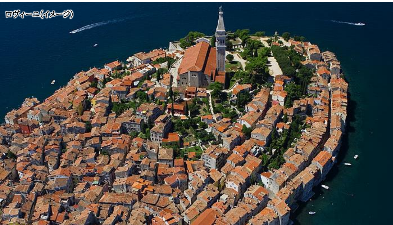
ロヴィーニ(イメージ)

ご旅行期間とご旅行代金 【旅行代金には燃油サーチャージが含まれております】 2026年 9月15日(火)発～9月28日(月)着・・・¥898,000 一人部屋利用追加料金 ¥130,000