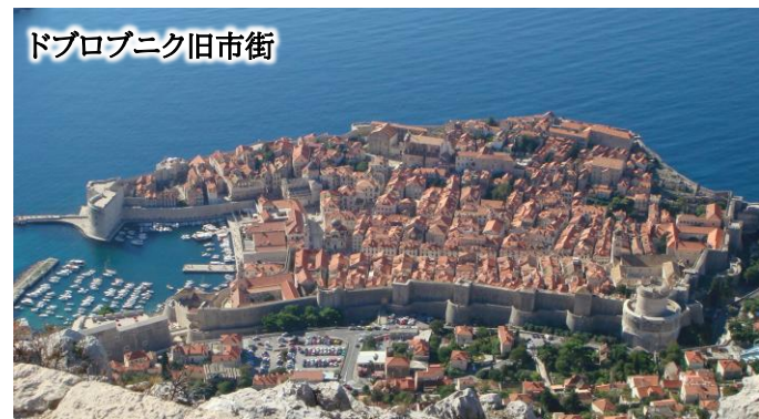
ドブロブニク旧市街