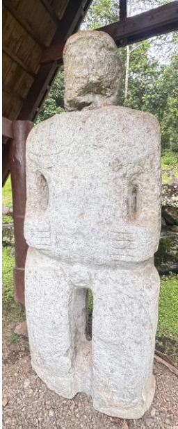
株式会社 イーテル・ツアー

ティキの彫刻技術はマルケサス諸島を中心に受け継がれており、ティキにはポリネシアの精神性や宗教性が凝縮されています。神話で語り継がれている創造主の長男を模したものだという説、初めて誕生した人間をかたどった繁栄と平和の象徴として作られたものだという説、土地を守るために捧げられた生け贄の人間の代わりに作られたものだという説、霊媒師に力を与える役割を持つという説など、ティキにまつわる伝説は地域によってさまざまで、その形や顔の表情も多種多様です。マルケサスの人々はこの彫刻技術に大変秀でており、ポリネシアの精神性を表現するクラフトマンたちは、タヒチでは最も尊敬を集める存在であったと言われています。イースター島のモアイ像についても、ティキがルーツではないかと考えられて、マルケサスの原始的なティキには、モアイ像よりもさらに異形のものが多く、宇宙からの訪問者(異星人?)の姿なのではないかという指摘もあります。