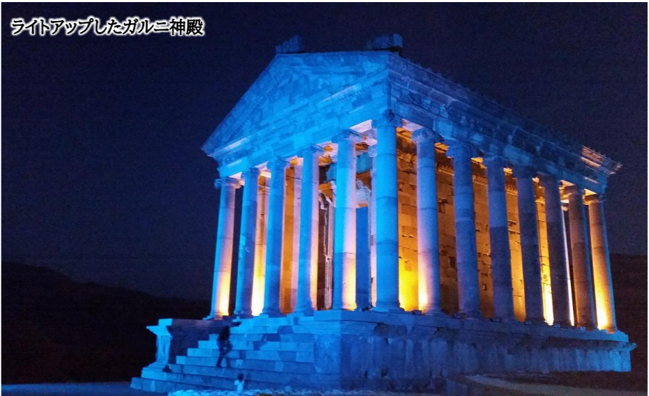
ライトアップしたガルニ神殿