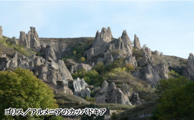
ゴリス／アルメニアのカップパドキア

古代から民族、文化の交差地として歴史的にも大変重要な要所だったアルメニア1ヶ国をゆっくりとご案内します。 世界で最初のキリスト教国であるアルメニアでは、独特なアルメニア様式の教会を中心に首都エレヴァンでも連泊しながらご案内します。 ホルヴィラップ修道院からアララット山の雄姿もご覧いただいたり、雄大なセヴァン湖も訪ねます。 また、アルメニア東部に位置するゴリスにも連泊し、世界最古のワイナリーや天文台、『アルメニアのカップパドキア』などもご案内します。 ゆったりと且つたっぷりと巡るアルメニアの旅です。美味しい伝統料理もご堪能ください。